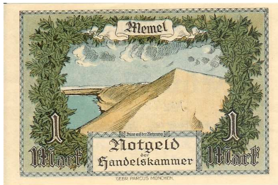
Billet de 2 Mark