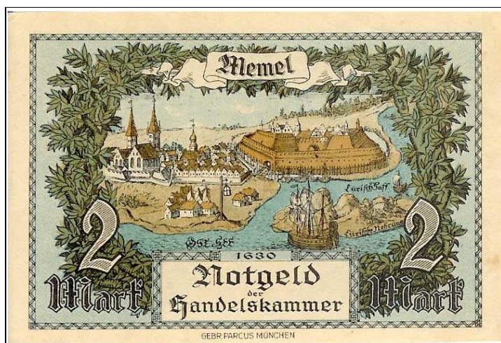
Billet de 2 Mark