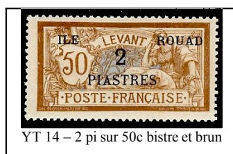
YT 14 - 2 pi sur 50c bistre et brun