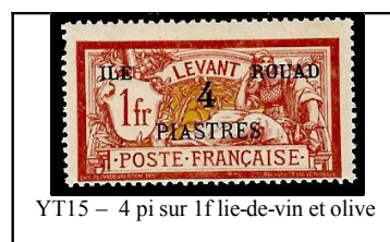
YT15 - 4 pi sur 1f lie-de-vin et olive