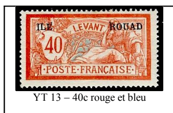
YT 13 - 40c rouge et bleu