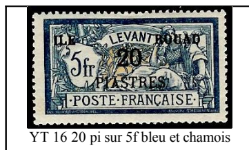
YT 16 20 pi sur 5f bleu et chamois